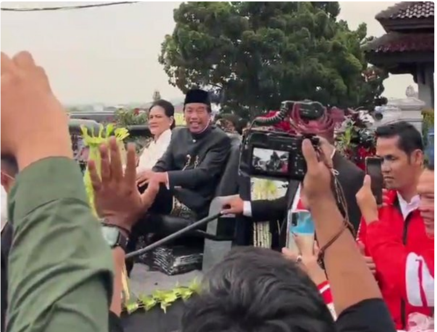
Foto: Antusiasme warga Solo memuncak saat mantan Presiden RI ke-7, Ir. H. Joko Widodo, kembali ke tanah kelahirannya pada Minggu, 20 Oktober 2024.

SURAKARTA- Antusiasme warga Solo memuncak saat mantan Presiden RI ke-7, Ir. H. Joko Widodo, kembali ke tanah kelahirannya pada Minggu, 20 Oktober